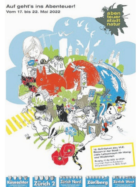
Das spielerisch gestaltete Cover der Sonderzeitung «Abenteuer Stadtnatur». Sie liegt dieser Zeitung bei.

Ein grosser Naturfan ist auch Corine Mauch. Die Stadtpräsidentin erzählt, wie ihr Grossvater selber Bienen hatte. Darum sind sie mir vertraut und lieb. Wildbienen sind wirklich interessant. Ich achte auf bienenfreundliche Balkonpflanzen. Toll finde ich, dass Private vermehrt